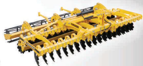
Model zawieszany, składany 4,5 m. Wał kłatkowy Ø526