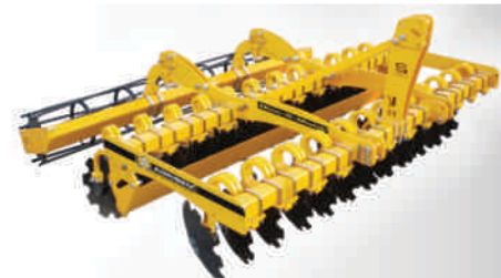
Model zawieszany 3 m. Wał kłatkowy Ø450