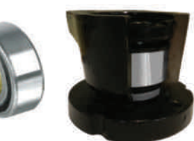
Podział tożyska SRE

pracy złelne = niezawodność ysokiej prędkości